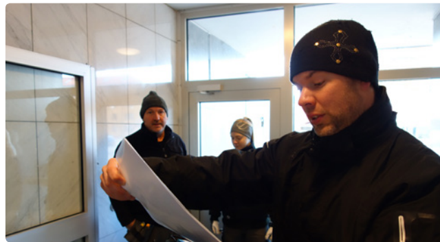
Under en trygghetscertifiering går Länsförsäkringar igenom allt som är viktigt för säkerheten i en fastighet.

Inspektionerna handlar om sådant som belysning, lås, brandskydd och utrymningsvägar, men också om att entréer, lägen-