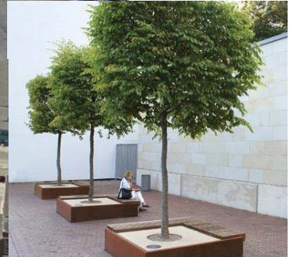
Norra Grängsbergsgatan som ett handelsstråk? Tankarna är många kring gatan. Skiss och bilder: Studio Sueca

Fastighetsägarna BID Sofielund Besöksadress: Nobelvägen 23/gavel Post: Idungsgatan 2, 214 30 Malmö Telefon: 073-383 53 51 E-post: info@bidsofielund.se www.bidsofielund.se