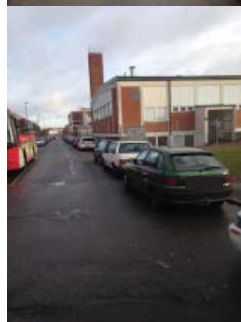
Uddeholmsgatan med grangator och Västanforsgatan är några av de stråk som får boendeparkering i höst.

Fastighetsägare BID Sofielund är en förening som tillsammans med boende, Malmö stad, föreningar, företag och verksamheter vill fortsätta utveckla Sofielund till en attraktiv del av Malmö, som alla kan känna stolthet över. Fokus är på Boende, Integration och Dialog . Fastighetsägarna väljer att med sin medverkan ta ett stort ansvar genom att bidra ekonomiskt till verksamheten. Som medlemmar i föreningen är alla välkomna som äger hyresrätter, bostadsrätter, lokaler och företag. Vi ska bidra till en positiv utveckling, skapa långsiktig trygghet för att öka den kollektiva styrkan och området ska präglas av en seriös fastighetsförvaltning. Medlemmar är: MKB; Malmberg Fastighet, Fastighetsägarna Syd, Lifra, HSB Malmö, Lars Anderssons Fastighet, Heimstaden, Ikano Bostad, Willhem, Brf Cykeln, Gamla Byalaget Sofielund, Byalaget Sofia, E.ON, Leijon Fastigheter, Celica Fastighetsförvaltning, Kungsleden, Pagens, Xtera Förvaltning AB, Stadex, Brf Grängeshus, Sofielunds Företagsgrupp, Handelsbanken Amiralsgatan, Brf Lönnen, Carlssons Europeiska Konsult, Eroom Properties, MINE, Brf Sevedsgården, Brf Intagan, Brf Klara, Trianon.